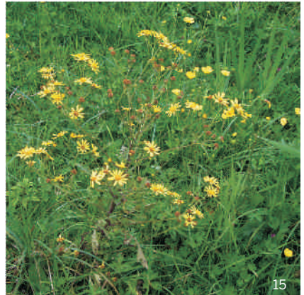
Abspreizendes Kreuzkraut ( Senecio erraticus )

Verwechslungsmöglichkeit mit weiteren Senecio-Arten, die aber ebenfalls giftig sind, ist unter anderem Abspreizendes Kreuzkraut ( Senecio erraticus ).