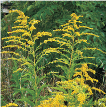
Kanadische Goldrute ( Solidago canadensis )