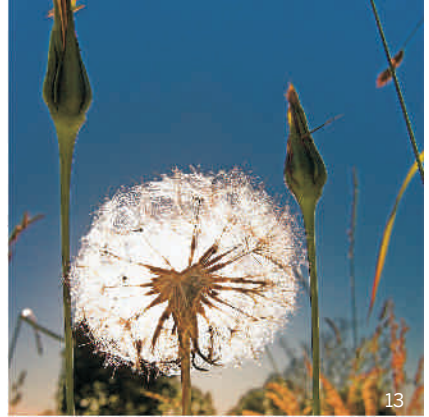
Wiesen-Bocksbart in der Samenreife