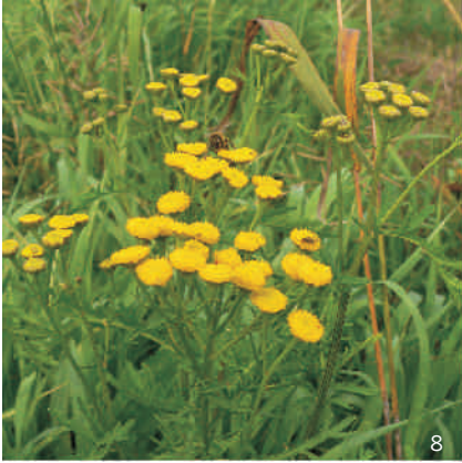
Rainfarn ( Tanacetum vulgare )