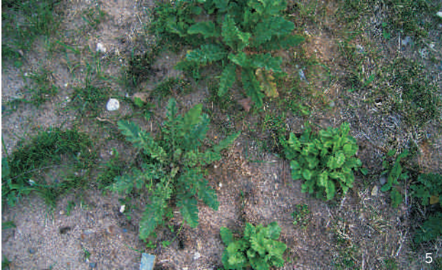
Blattformen im Rosettenstadium

Der Stängel ist an der Basis rötlich, ansonsten grün, kantig gerillt und teilweise spinnwebartig behaart. Die Stängellänge liegt zwischen 20 und 130 cm.