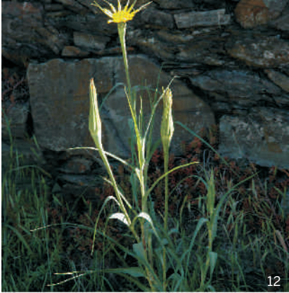
Wiesen-Bocksbart ( Tragopogon pratensis )