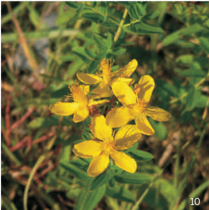
Johanniskraut ( Hypericum spec. )