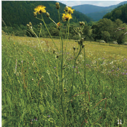
Wiesen-Pippau ( Crepis biennis )