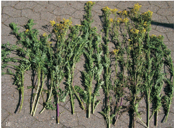
15 Triebe entsprechen 1000 g Frischmasse oder 150 g Trockenmasse

Die Gefahr ist erheblich, wenn man sich vor Augen führt, dass ein einzelner ausgewachsener Trieb im Mittel etwa 70 g Frischmasse oder 10 g Trockenmasse wiegt. Die auf dem Foto unten gezeigten 15 Triebe haben zusammen bereits ein Frischgewicht von 1000 g.